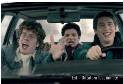
Est - Dittatura last minute