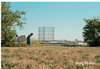
Being My Mom

Ingresso libero con prenotazione obbligatoria