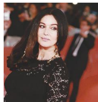
"Diva e donna" L'attrice Monica Bellucci