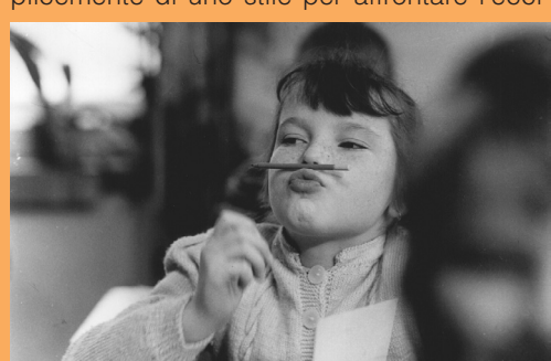
I bambini di Goltzow

In un'epoca in cui i media ci propongono come modello la quotidianità dei reality show, non ci resta che recuperare exempla che abbiano saputo resistere all'erosione della storia, e vite che abbiano meritato di essere raccontate. È un'operazione quasi istintiva quella di guardarci attorno alla ricerca di un significato, di un fine o semplicemente di uno stile per affrontare l'ecce-